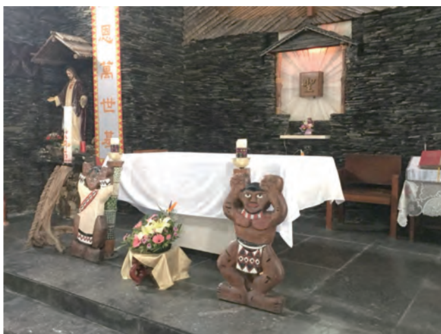
▲知本聖母無染原罪天主堂原住民人形祭台設計

接著，來到寶桑路宗徒之后天主堂，這聖堂是白冷會傳義修士的作品，猶如隱身巷弄的天堂，祭台後方光影的變化，讓人讚嘆天主聖神的奧妙，在至聖所兩側壁面各懸掛一幅聖母與宗徒們的畫像，熱心教友為聖母增添美麗編織飾品。教堂外觀明顯的皇冠及十字架，象徵痛苦犧牲的耶穌基督，最終戰勝罪惡與死亡，這個記號勉勵我們：忍受試探的人是幸福的，因為他既經得起考驗，必能得到主所預許的生命之冠。1965年於此堂成立公東高級工業職業學校附設技藝訓練班，吳若石神父初期就在此教堂教導教友足底按摩的技巧。