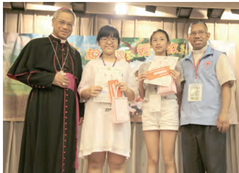
▲青少年組參加者與神長們合影