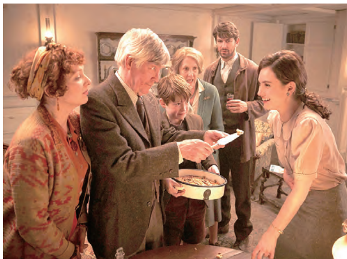
▲《真愛收信中》探討人性的面向與閱讀的力量，在嚴謹中有詼諧，在歡笑裡又讓人熱淚流淌，是一部真摯而溫暖地用愛朗讀生命的詩篇。