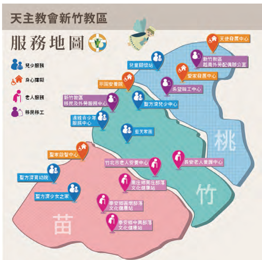
▲新竹教區社會服務範疇示意圖

當然！您的加入是我們最大的動力，歡迎您到Big City (巨城) 親自體驗捐款機器，以實質的鼓勵給予我們支持，期待與您在巨城相見。如果不克到現場體驗智慧捐款機，也歡迎掃描QR CODE，支持新竹教區的社福工作。