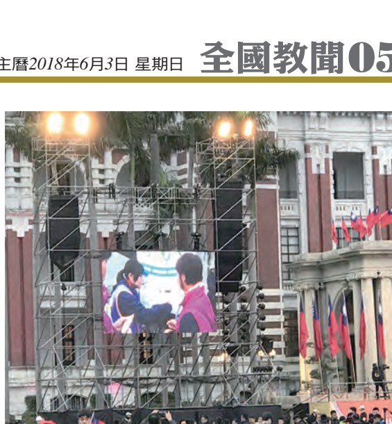
▲新竹縣點燈活動：吹泡泡募款機十分吸睛。 ▲慈善教育從家庭扎根，從小做起。 ▲元旦在總統府前設攤位，吸引眾多媒體採訪。 ▲元旦共好市集特寫，登上總統府前的大螢幕。