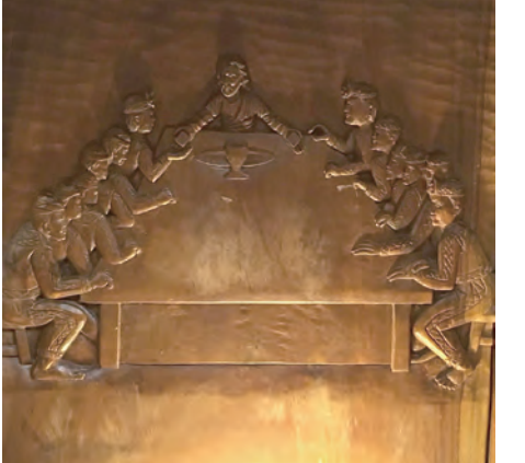
▲金崙天主堂內祭台上最後晚餐木雕藝術