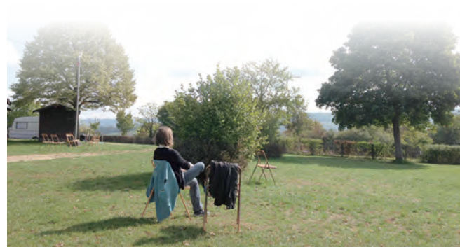
▲工作有時，休息有時。