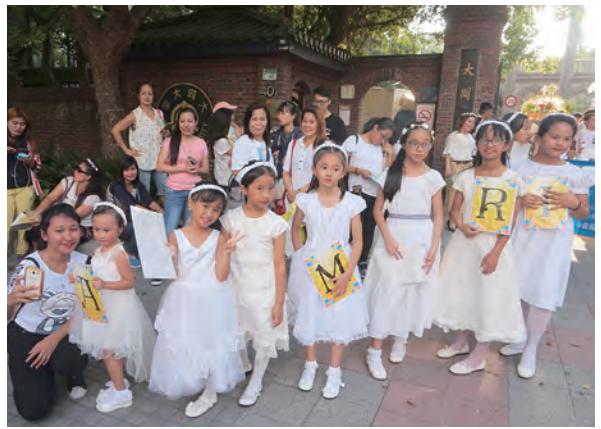
▲兒童道理班小朋友個個盛妝打扮，在出發前留下可愛身影。