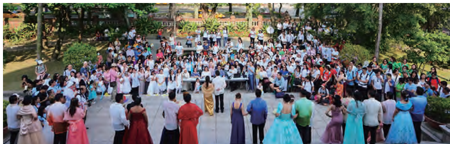
▲在大同大學美麗的校園內舉行傳統選后活動，盛況空前，佳麗們使出渾身解數爭取后座。

16位后選代表在儀態展演及發表演說後，最後選出了Charismatic Group皇后為聖母媽媽加冕，隨即在精心製作、各具特色的鮮花拱門前導下，浩浩蕩蕩地展開聖母遊行，迤邐數百公尺的美麗隊伍，或載歌載舞，或誦念玫瑰經，或與路旁民眾親切互動，因信仰而蒙福的歡笑臉龐，作了最美的福傳。