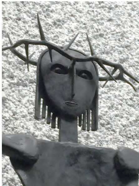
▲台東教堂內耶穌像特寫，臉部五官有原住民特色。