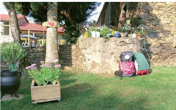
▲驛站一隅，勞頓時的歇腳處。

從Camino到泰澤，是一條與天主，與自然、與人的共融之路。我們結束旅程，返回原有的生活，勉勵自己在生活中繼續走朝聖路，划向深處去。