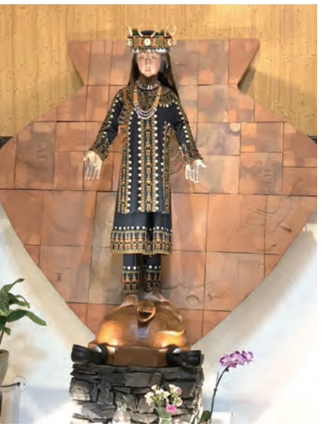
▲太麻里金崙天主堂身穿排灣族傳統服飾聖母像

我們拜訪東海岸公路旁的小馬聖尼克老天主堂，一群天邊來的異鄉人，他們都是瑞士年輕又帥的修道人，將其一生獻給台灣成為東海岸山脈的守護神，