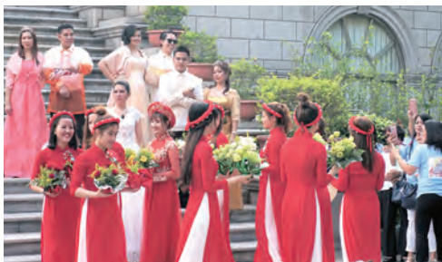
▲越南團體的獻5色花傳統舞，優雅曼妙又有深意。