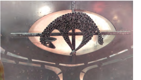
▲台東教堂內祭台上的獻祭羔羊