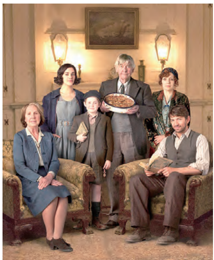
▲「根西馬鈴薯皮派文學讀書會」的成員，無論男女老幼，都在閱讀中，找到了幸福。