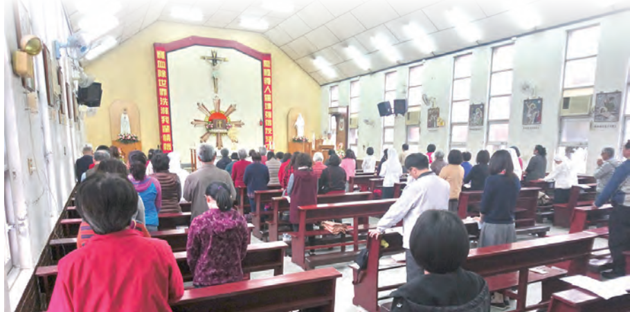
▲全國聖體大會聖體要理講習會在嘉義主教座堂舉行明供聖體

我們若要在聖體聖事中與基督相遇，我們必須謙遜的貶抑自己；因為聖體聖事就是耶穌基督空虛自己的奧秘。在最後晚餐時，耶穌為門徒們洗腳這一切就證明了耶穌空虛自己。如果我們不能下跪，不願意給別人洗腳，我們便不