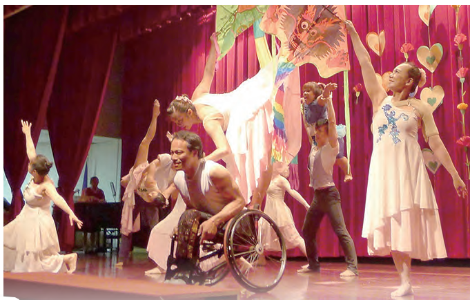
■文·圖片提供／何芯妮（靜修女中生命教育中心）