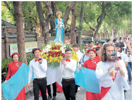
▲越南團體扛著穿著傳統越南服飾的聖母抱聖子態像遊行

了很多東西支持活動，參與愛心攤位，奉獻時間心力，不但提供豐富攤位內容，許多攤位還愛心捐出當天全部義賣收入給仁愛基金會；這項愛心園遊會，把歡笑與快樂分享給每個人，再次感謝所有參與園遊會活動的單位、貴賓、設攤攤位、民眾的支持，共同推展啟智宣導，讓愛閃耀，我們明年見！