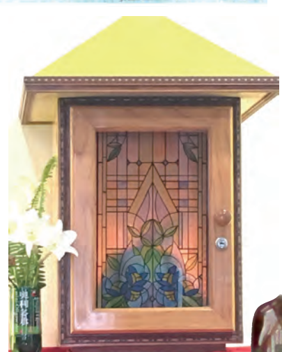
▲森永露德聖母天主堂聖體龕 ▲白冷外方傳教會院內十字架藝術

白冷外方傳教會錫質平神父創辦了以培養優良技工聞名的「公東高工」，作育英才無數，也幫助了許多失學的孩子，使東海岸的年輕人在瑞士傳教士們兼具專精技術及宗教情懷陶冶教育之下，每個青年都具備