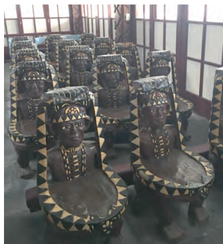
▲知本聖母無染原罪天主堂卑南族圖騰座椅

當我們看到知本聖母無染原罪天主堂時，異口同聲說，我們如果能在這堂望一台彌撒該有多好，接著就遇上了本堂神父關神父，他慨然答應後天早上8時為我們舉行彌撒，這簡直是太美了，確實印