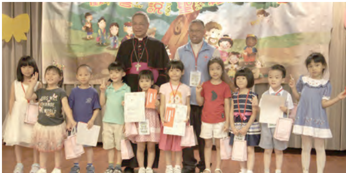
▲幼幼班參加者與神長們合影