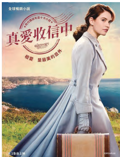
▲《真愛收信中》是一部關於愛、學習與閱讀的感人影片，帶給窮苦人無限希望。

閱讀，成了避風港，是心靈捕手，是生活導師，是精神寄託，影片中，讀書會的分享或是戲劇性朗讀，或是一圓寫作的夢想，或是讓人會心於彼此的關愛照顧，共度艱苦歲月，在在都是愛、寬恕、包容與學習的生活意境；是天主要我們遵循的「你們要彼此相愛，如同我愛了你們一樣。」以書會友，是汲汲營營生活裡的滋養，讓我們從好書中更懂得付出，懂得活出愛，幸福的療癒力，就在淡淡而深刻的字裡行間啊！