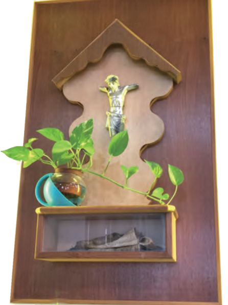
▲森永露德聖母天主堂內受祝融之災斷臂的耶穌像