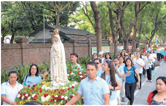
▲聖多福天主堂慶祝聖十字架節的聖母遊行，長長的隊伍望不見盡頭。