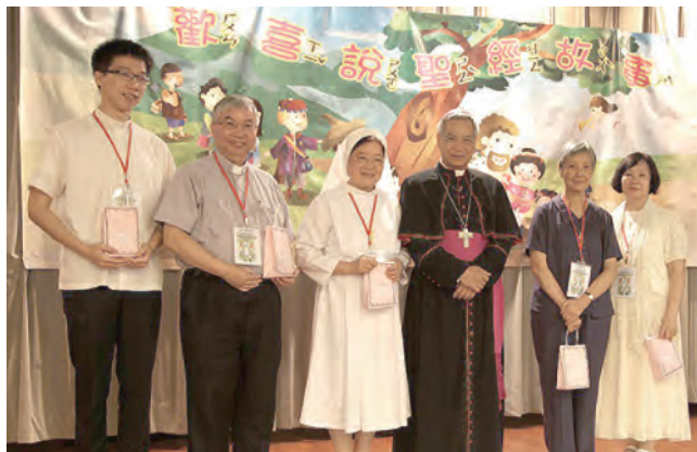
▲兒童說聖經故事比賽的評審團，與洪山川總主教合影。