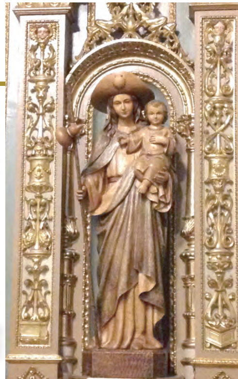
▲泰澤村門口的鐘樓，提醒訪客一日3次的祈禱。 ◀泰澤的祈禱廳：修和堂。 ▶聖母化作朝聖者的樣貌