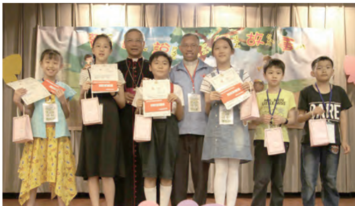
▲中年級參加者與神長們合影