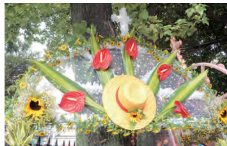
▲用鮮花精心製作的拱門，展現節慶文化氛圍。