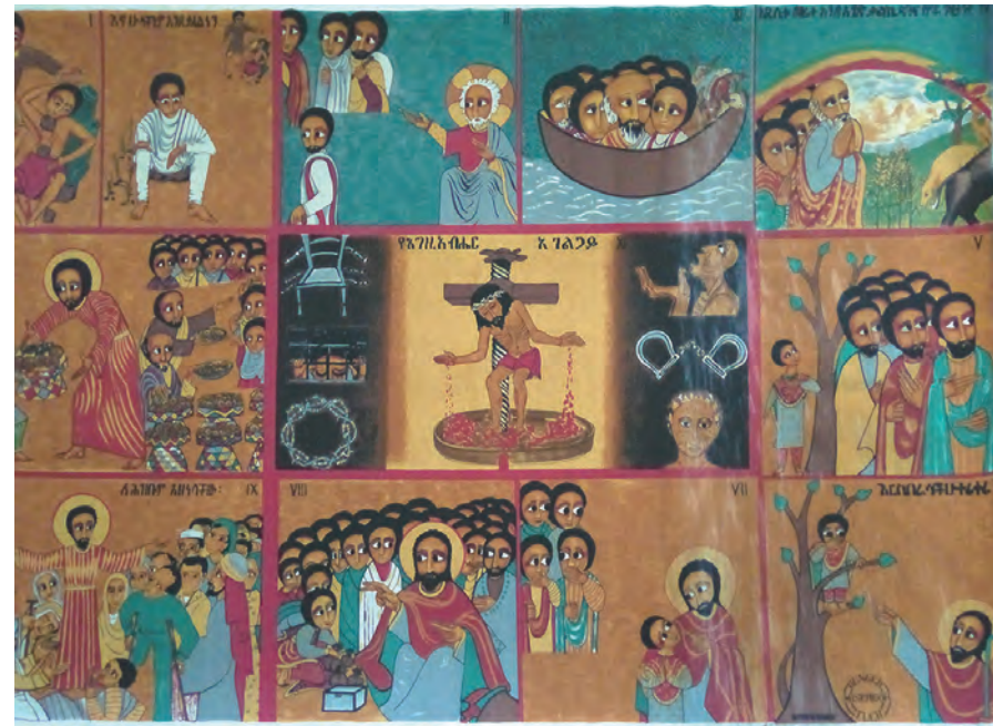
▲白冷外方傳教會會院餐廳內部掛飾敘述耶穌生平事蹟