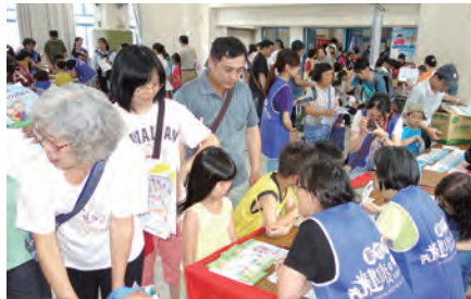
▲新竹市衛生局也加入衛生健康宣導 ▶李克勉主教與政府長官及協辦單位留下愛的見證

開場由活力四射的中華國際熱愛大自然促進會總會帶來的「快樂操」；埡欣幼兒園及傑恩幼兒園的小朋友，舞姿活潑又可愛；春風樂團的薩克斯風及小喇叭表演、琴舫樂器公司Artis室內樂團演奏的弦樂、磐石中學聖歌團，讓整個園遊